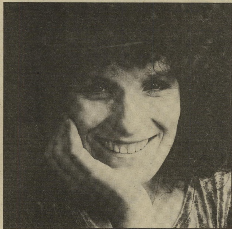
זמרת גלרון שירים נפלאים מילים נפלאות

מקוים כי גם הפעם ההצלחה תהיה דומה. זו פריעת שטר-חוב מצלחת: לחברת התקליטים, לחשבונות הבנק ולשאיפה הישנה לבצע שירי ספר. מאור אהבי את ברזזה הרקיסט, בסלף.