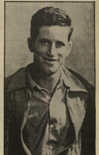
לוחם ג'ימי שמי נאיביות מופלאה

עד לשנים האחרונות התברכו ילדי הארץ הזאת בכך שראו כשירות הצבאי משימה של חוסר-ברירה, ולא ייעוד. התוצאה: כמה מהרמויות