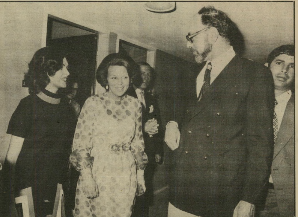
ביאטריס, מלכת הולנד, במפגשים ואירועים רישמיים נוהג מוסינון ללבוש מיקסטורן ועניבה, אך בבית הוא נינוח יותר ולובש ג'ינס וחולצת טריקו.

סופית ונסעתי למונטריאול. היתה לי ידידה טובה שהיתה ריילת שם, ונסעתי בעיקר בגללה. שם הייתי סגן מנהל בית ישראל באקספו 77.