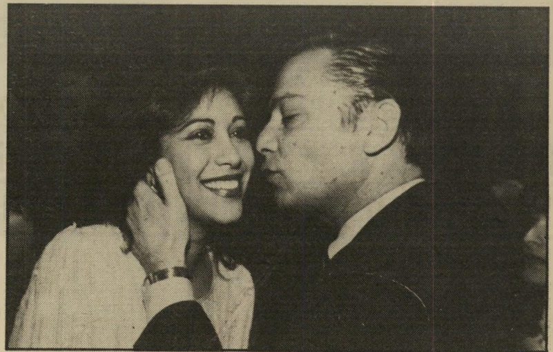
ברדנית חזה ומנהל סער נסינות בוטר