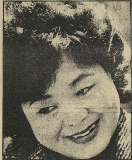
ניצולה סטטוקו מסכימה להיות סמל

כמו ברוב ארצות מרכז-אמריקה, ההצלחה היתה חלקית. מישטרי-הדיכוי אינם פרי הגורל העיוור, ותמיכתה של ארצות-הברית בהם איננה סתם שגיאה, המחלישה את מעצמתה העל במאבקה נגד ברית-המועצות. השגיאות האלה נובעות מכוחה האדיר של שרולת בעלי-ההון בוששינגטון, ומהעובדה