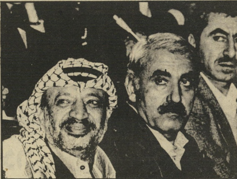
חזותמה, חבש וערפאת מי אופורטוניסט, ומי לא?

הדבר אינו מובן מאליו. ביקורו המהדים של ערפאת אצל חוסני מובארק, אחרי היציאה מטריפולי, עורר אצל כמה מאנשי מורת-רות, מפני שלא ביקש ולא קיבל אישור מראש לכך מטעם מוסדות פת"ח. כמו בכל אירגון שיש בו מנהיג חזק ובעל-כאריזמה, נשמעים גם בפת"ח מדי פעם קריאות ליתר