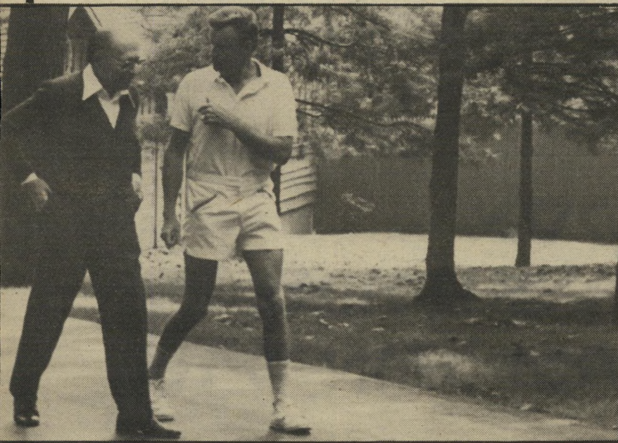
בז'ינסקי עם בגין (בקמפיין-דייוויד) בייביי — למי?

זה ברור גם לממשלת-ישראל. כבר בימי ממשלת-דובין נקבע הכלל שאסור להניח לאנשים אלה להגיע אל המועצה, כדי למנוע מתן ציון מתון לאש"ף. רבין, כמו בגין ושמיר אחריו, העדיף אש"ף קיצוני, המבצע פיגועים והמקומם את העולם נגד העניין הפלסטיני, על פני אש"ף מתון, המוכן לשלום, ושיביא ללחץ עולמי על ישראל להחזיר את השטחים הכבושים.