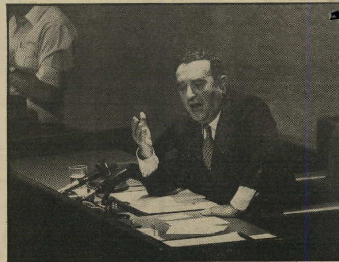
סבירור בעת ניהול ישיבה בנשימה עצורה

צעדו התקיף של סבירור הביא, כרגיל, לגל של סרשנויות מכל הסוגים, ואף לזויכות לגיטימי בכל הנוגע לזכותו