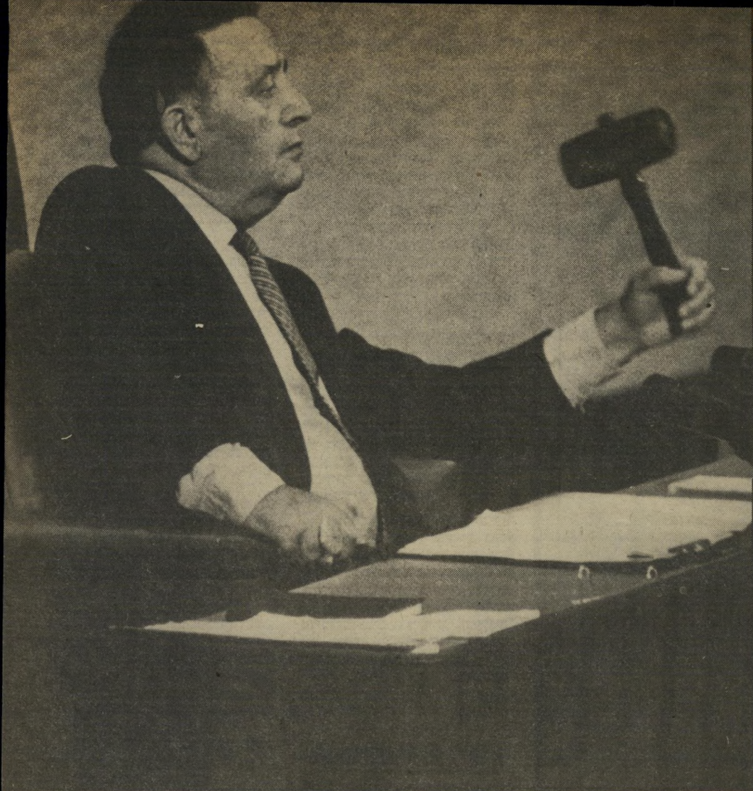
כבוד היו"ר "כבוד הבית"

קצת מצחיק להפוך רמות כל-כך. בשך ורמית' כמו סבירור, לגיבור הרמוק' רטיה, אבל את המציאות אין לשנות. את העונדה שהשכוע הוא פרע את מלוא המחיר, אפשר רק להוסיף לזר' הרפנה שלו. במפילגת, השקרנים" (לפי ח"כ בני שליטא), הנוכלים" (לפי שלמה להט) "אכולי השינאה ההרדית" (לפי יצחק ברמן) והאפסים (לפי הקונסנוסם הלאומי), אין מקום לאנשים כמו סבי רור.