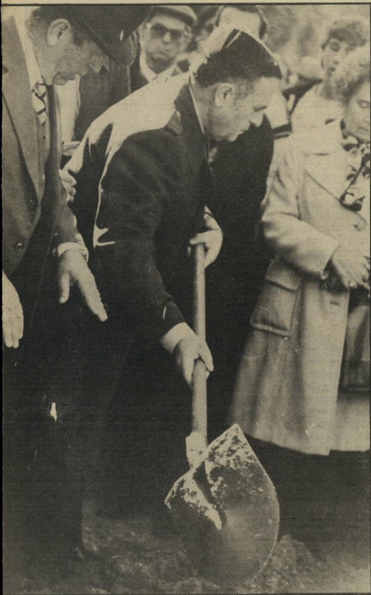
סבירור בהלוויה קבר פוליטי?

עצמו, שראה בסבירור עוד ח"כ ניצי, חרותניקי-ציוני-כללי מהשורה. התהליך שעבר, קצת מזכיר את תומס בקט, הבישוף האנגלי שמונה עלידי המלך, כדי להכסיף את הכנסיה לחצר המלוכה, והסך, עם קבלת מישרתו, לנושא דגל הדת נגד השילטון החילוני?