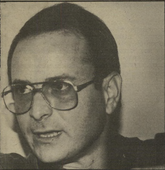
ראשיקבוצת מילוא ובשביעיות