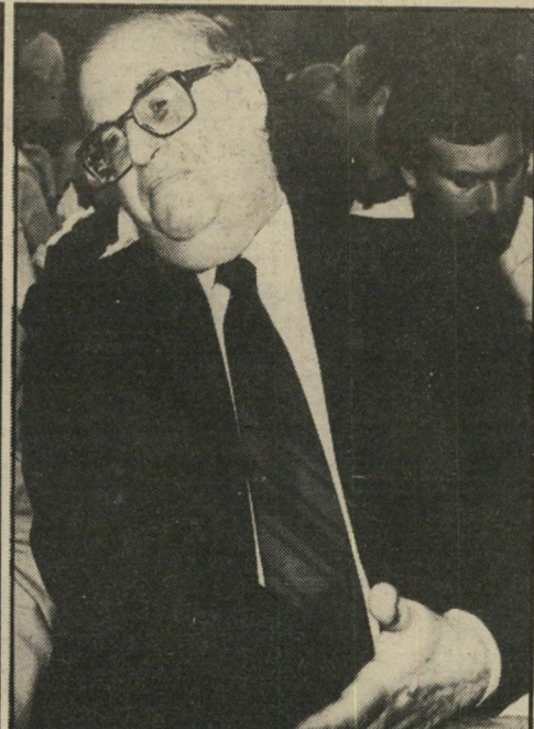
נבון לא ביקש הבטחה