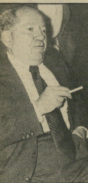
שרי-לשעבר שרף מן הקיבוץ להקמת מדינה

המדינה הציע שרף, בפשטות, לכתוב על הבולים דואר עברי בשנים שלאחר מכן היה שרף מזכיר הממשלה הראשון שהיה לשר (מטעם מפא"י, במשך 14 שנים, כשר התעשייה והמיסחר, האוצר והשיכון).