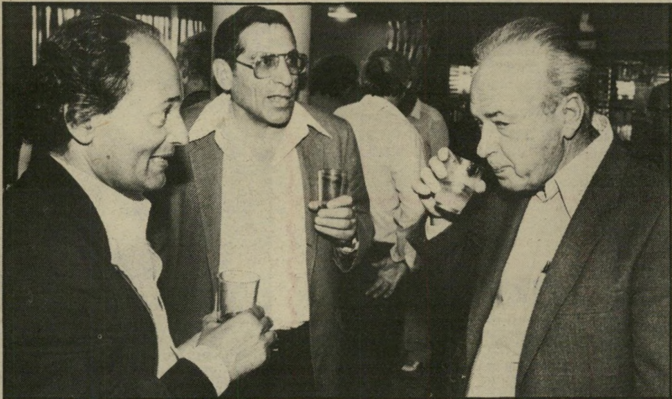
והמהלכים הבאים של ברי-כוכבא, כמי שכונה בשעתו אורי דן את הגנרל שרון. רבין לא נראה כל-כך נלהב מהשיחה, אך רחבעם (גאנדי) זאבי, התלהב מאוד ממה שהשמיע יועצו של שרון באוזני רבין.