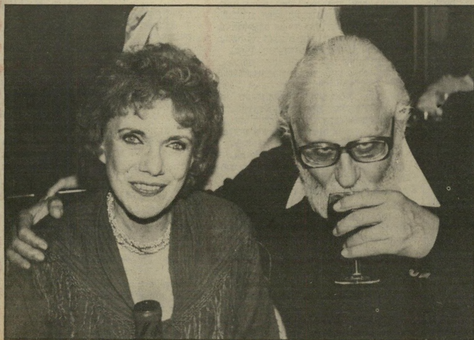
לפני ילדי ישראל שאוהבים כל-כך את תהילה. האג הוא מוסיקאי, ורק במיקרה הגיע למישחק. עכשיו הוא גם כותב מוסיקה וגם משחק. אשתו שחקנית, וגם כותבת — לא מוסיקה, אלא פרקים לתהילה.