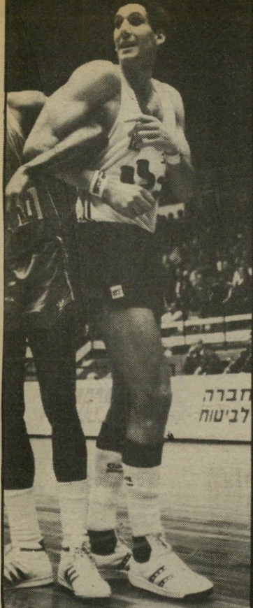
כדורסלן ג'אמצי לכסות את החובות

אך לבסוף נאיית הכיכב העולה של בית"ר להיכנס למדיספורט. לשיחק לפני המנוחה העולמי למשך חמיש רפות בלכה. לבהרת לא איהרו ה"בתרות לכיא: מה חושב פינולי על אוחנה.