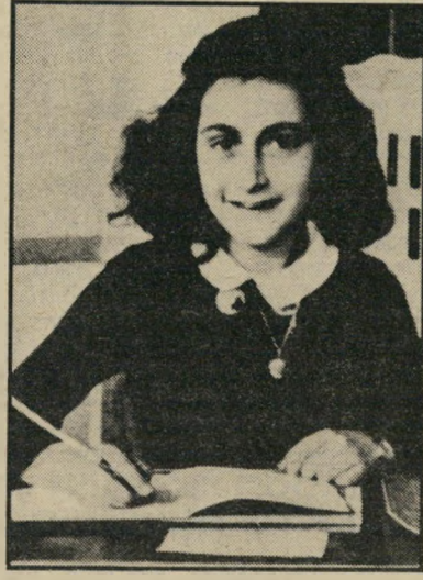
אנה פרנק יותר ממיליון ילדים

ראייתו הנאיבית-ילדותית, דרך מיכלול סימלי הילדות של עולם קורד זה, מתיאור של חיים רגילים עובר הסיפור בהדרגה לעולם הגטו, וילדה הלומדת לחיות בתוך עולם זה: לקחה את תרמול הגב הגדול והחישאה את צעדיה בכיוון המיגרש, שתר גרול הזדנב לידו, ברגיל... הילדה-נערה, גיבורת הסיפור, מתארת את סבה ואת הוריה ואת הסכל ההולך וגובר בין חומות הגטו. ישנם בסיפור פלאש-בקים לימים שקדמו למילחמה, ימים שבהם קראה הגיבורה את מחניים לסרנץ מולנר, והוילהה הרמעות על מותו של נמצ'ק הקטן, מוות של ילד אחר,