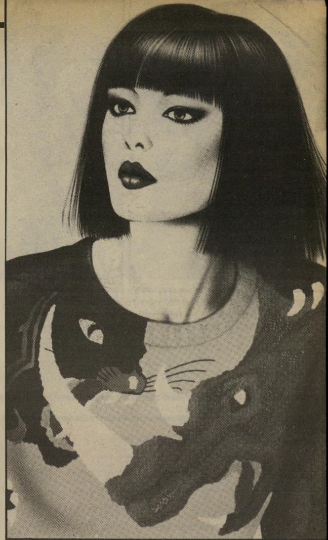
קארה יפאני עדות לכך שהיאנאים משתלטים לא רק על אופנת הבגדים, אופנת הבגדים, אלא גם על התיסרוקות: נשות פאריס, רומא, וגם תל-אביב זהות כולן, קצוצות שיער בתסרוקת הקארה.

כל סוגי השיער מתקבלים בברכה באביב. קיץ '84 כשהתיסרוקת האופנה תית ביותר היא הקארה המסוגנת והנקי, אשר נראה אחרת בכל סוג שיער. השיער הארוך יצא מהאופנה והתיספורת הקצרה תפסה את מקומו, כשהצללית של הקארה יכולה להיות שונה מאשה לאשה, לא רק בהתאם לסוג שיערה, אלא גם בהתאם לתיספורת עצמה. כלומר למיספריו של מעצב השיער. ישנו קארה עד