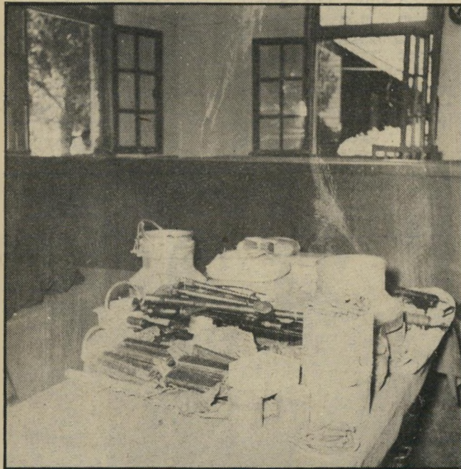
מחתרת צריפין: הכניסה לאיזור בית-המישפט הצבאי ומצבורי-הנשק הממונה על שרותי-הביטחון הציע חנינה