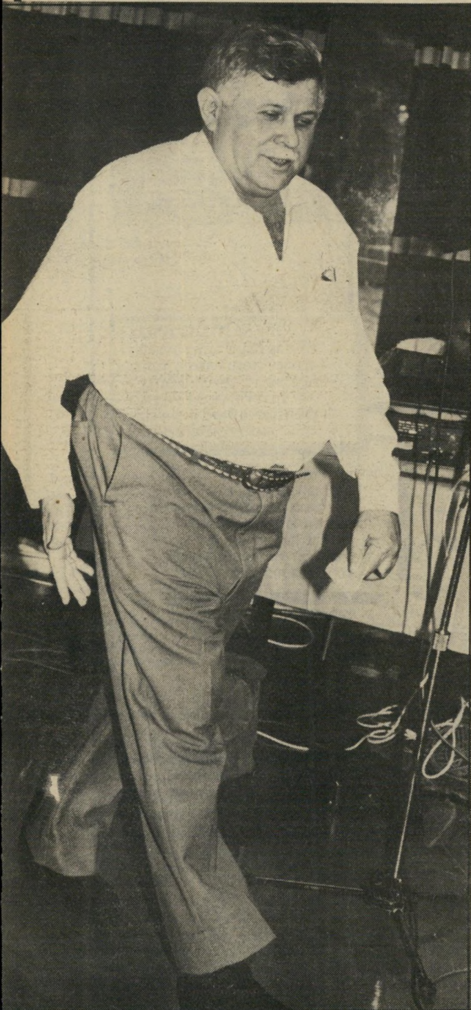
שר גרופר הבנים האובדים שבים הביתה