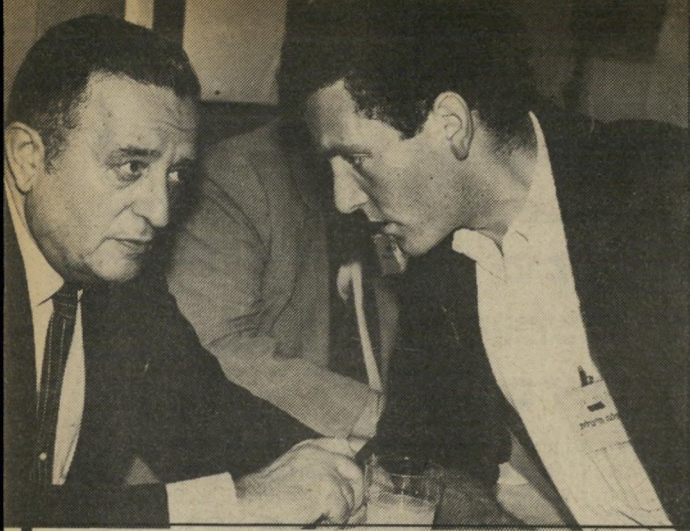
יו"ר הכנסת סבירור (ובנו, רב) שלא יתנכלו לו על הגיונתו

סגן שרי האוצר לשעבר, יחזקאל פלומין, מהרשימה המרכזית, שלמה ("צ'יץ") להט, ראש עיריית תל-אביב, שבשבוע שעבר אירגן שדולה לסכ"י דור. דווקא במצב כרבים זה, ואם לוקי חים בחשבון נדידת-קולות אפשרית מצד לצד, יקבלו מודעי וניסים כל אחד 90 עד 100 קולות. מכאן שהכל (המשך בעמוד 56)