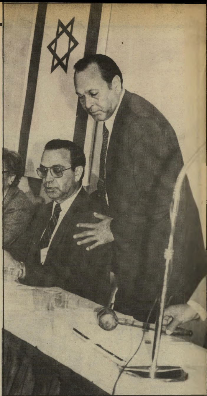
שרים מודעי ופת על חודו של קול

ייערכו השבוע גם ההצבעות החשובות, התפוצצה למעשה ישיבת המועצה, שהתכנסה כדי להכריע בשלושה עניינים מרכזיים: כיטול מחסום 60 האחוזים למי שמעוניין להתמנות לתקופת כהונה שלישית בכנסת, שריון שניים מבין 18 המקומות הבטוחים לחברי איגוד העובדים הליברליים, הצעתו של יושב־ראש הכנסת, מנחם סבידור, שהמועצה תבחר את מנהיג המפלגה. תישעה לא משחקים. תוצאות אותו הערב לא הפתיעו את מי שעוקב מקרוב אחרי המפלגה המרתקת הזאת. סבידור הבין, שאין לו כל סיכוי — גם