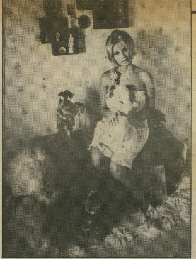
השחקן רוג'ר מור, כוכב סידרת הטלוויזיה המלאך וכמה מסירטי גיימס בונד. בתמונה משמאל - כך היא נראתה השבוע בתל-אביב, כשהגיעה ארצה לביקור מולדת מלוס-אנג'לס. שם היא מתגוררת בשנים האחרונות.