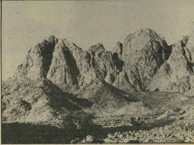
ג'בל סרבל, מבט מוואדי ריים אולי הרסיני

לא אני גיליתי את זה. עוד בתקופה הביזנטית הגיעו נזירים בעלי תרבות אירופית והם הלכו לסיני עם התנ"ך ביד. התנ"ך השתמר עוד מימי המגילות הגנוזות, שהתגלו בקומראן. הנזירים התחילו לחפש את משה ואהרון ולוחות הברית והשליחו והמן ומכות מצריים, כך שלא אני גיליתי את הדברים.