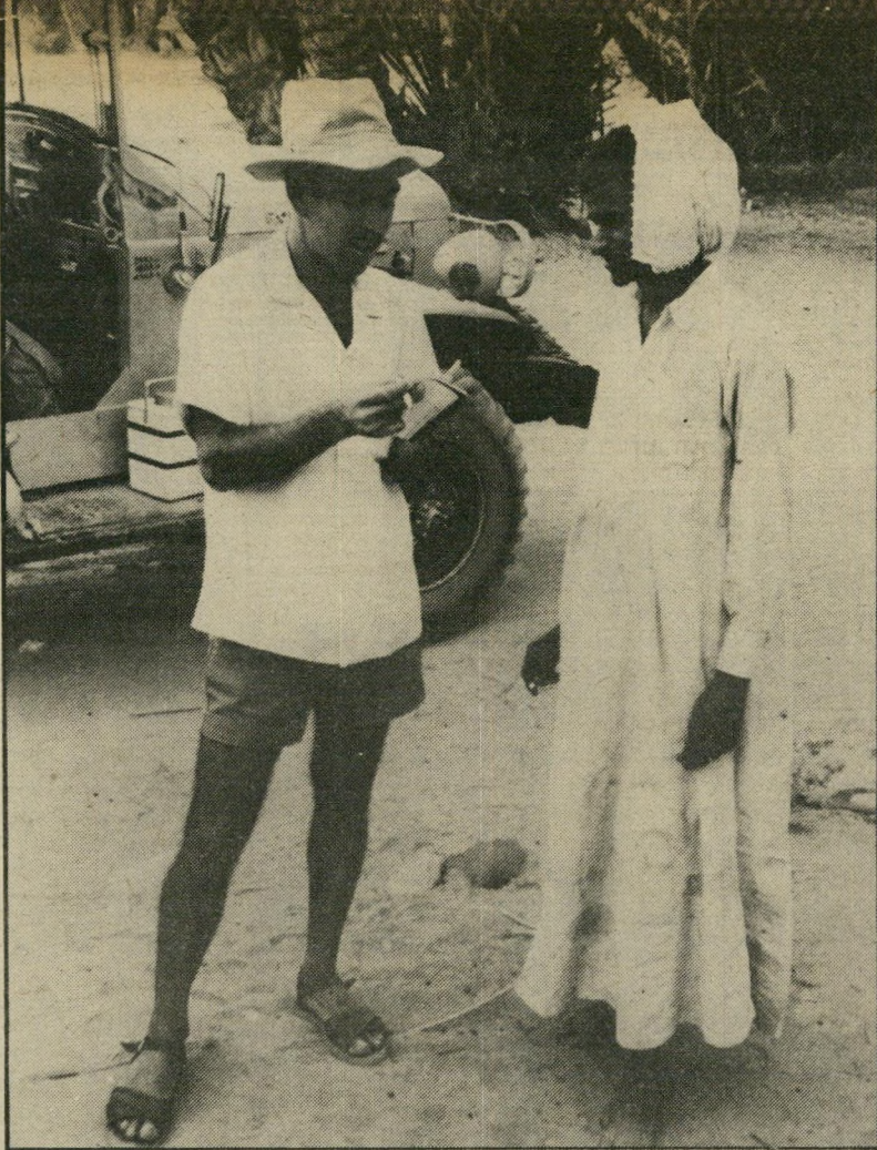
ארביאלוז משל עם ברויים ללכת בעיקבות הצאן