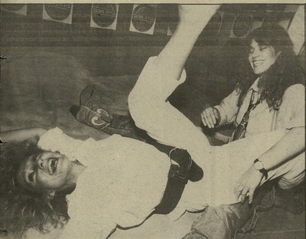
הריצפה והראתה להם את נחת זרועה. היא עשתה זאת כבר ב-100 הצגות עד היום. שחקני ההצגה סירבו לשתות בירה מכבי או להצטלם עם בקבוק. בטענה שאינם עושים מירסומת חינוך, אלא בתשלום.