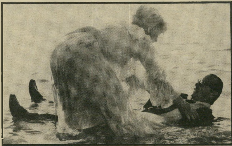
חתן ג'ק ניקולסון ובלה שירלי מקליין בתנאים של חיבה בלי פיאה נוכרית

ואכן, אין ספק שכל מי שיילך בימים אלה לראות את הצוות המובחר יגיע למסקנה שגיבורי הסרט, לכשייצאו לגימלאות, עשויים בהחלט להיראות כמו ניקולסון בתנאים של חיבה.