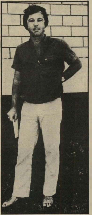
סופר נבות אושוויץ סיפרותי

את הסאגה הפאשיסטית שלו מתחיל נבות כבר בעמוד הראשון של סיפרו: לסגן המלך לא היו ספקות עוד בטרם עינה הספק את המלך: היטלר ברח מגרמניה והוא בכלל יושב במקום שבו לא עולה על הדעת לחששו: בבני-ברק,