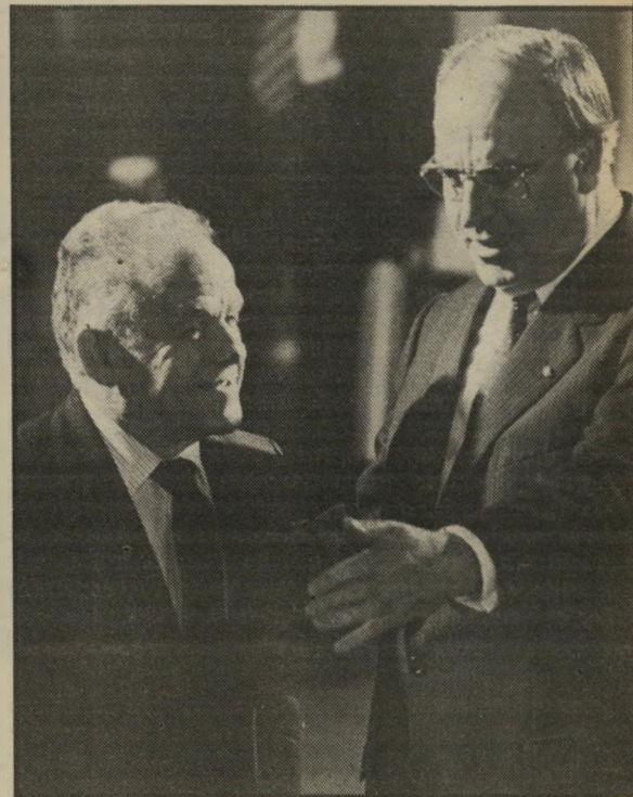
קנצלר קול* נא לבקר בבוואריה

המרובר בציבור ענקי: 26 מיליון גרמנים יצאו בשנה האחרונה לחופש מחוץ לביתם, ומתוכם 16 מיליון נסעו לחו"ל! האכסודוס האריך הזה הפך את הגרמנים לעם המטייל