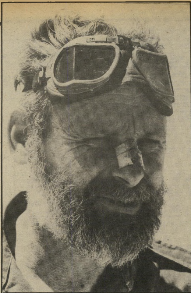
ימינן דווידי דם ואדמה

אפילו לא לקחנו איתנו נשק, כדי שלא נסתבך בקרב מיותר..." בטיול הראשון, מעל לכפר הלבנוני שובא, בנקודת-מישור לבנונית, נפתחה עליהם אש. הם הצליחו לחמוק ולהגיע לאיזור מעין-דבורך. בשתי הפעמים הבאות עבר הטיול לחרמון בלא תקלות. את סיפורו הראשון פירסם איתן איתן בקשת, שבעריכת אהרון אמיר. הסיפור מתאר את הטיול לחרמון, תוך תקופת שירותו הצבאי נשא אשה והתחיל להקים את משקו