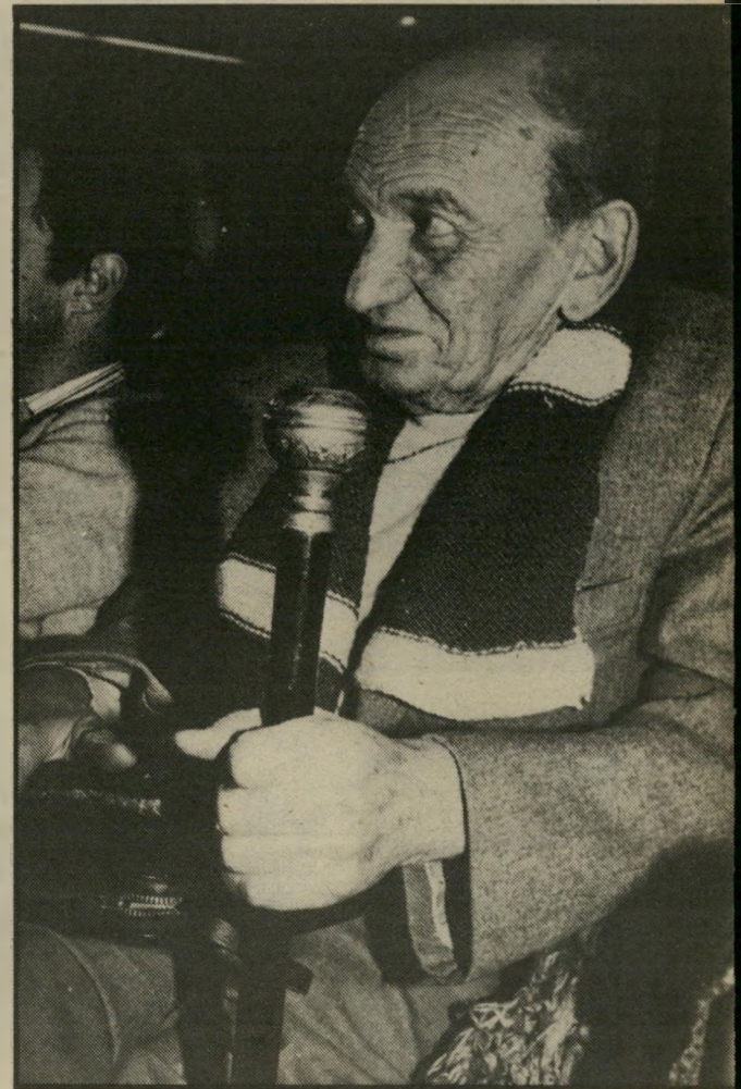
משורר רטוש אלדר + רטוש = ארץ-ישראל עד הפרת

"רעיון הברית המשולשת של עברים-לבנונים-דרוזים מוכר אף הוא. כששלטו הצרפתים בסוריה, ניסו לסכסך בין הדרוזים והמארונים ובין שאר הערבים בסוריה. הם המציאו אומה מארונית ו'אומה דרוזית', כמישקל נגדי לאומה הסורית הערבית. התכסיס נכשל, הצרפתים גורשו בכוחת פנים מסוריה ומלבנון. אך לפני כן נספג הרעיון עליידי צעירים