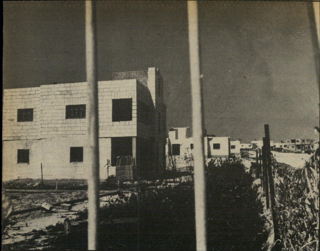
למצברים של מכוניות. ההתמרמות היא רבה. הטענה הנשמעת מפי כולם היא, כי ישוב יהודי לא היה עולה על הקרקע ללא תשתית של מים וביוב.

יילות ממוארות נבנות בשכונה 29, שאינה מחוץ ברת לרשת החשמל ושאינו כביש סלול בין בתיה. התושבים מתחברים לגנטורים פרטיים או