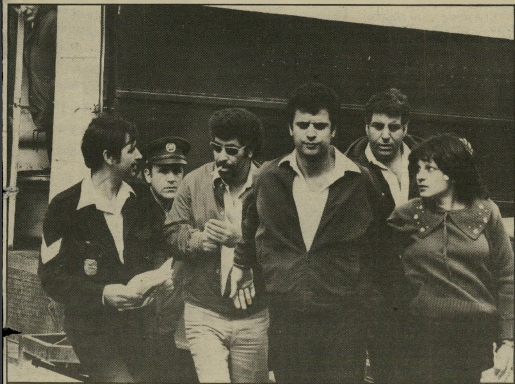
המישפט, שמר על פרופיל נמוך וניצל כל רגע לשהות במחיצת אשתו (מימין). שהתייחסה בעוינות גלויה לעיתונאים, שסיקרו את מישפט האונס.