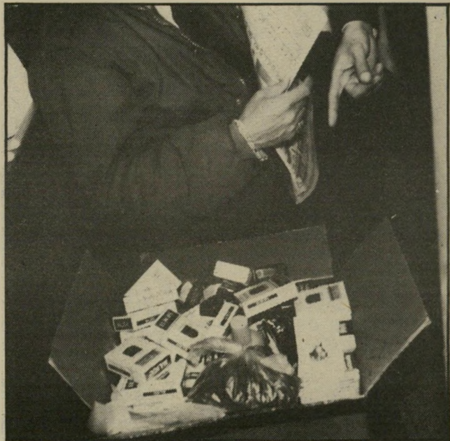
"צידה לכלא" אחיו של תוהמי ציידו את הנאשם לפי רשימה שהעביר להם על מתק. בין הדברים: שמפו, סדין, תשבצים, שש-בש, מיני סיגריות ומוזון. החבילה עוררה חשד.