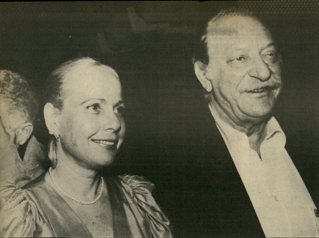
פרקליט אמנון רוזנשטיין ואשתו מלכה שאיפות נוספות

חברי הבורסה, ושער כה לא נמצא לו אישור, הוא על הקשר שהיה כביכול בין אהרון משולם רוני דרויש מנהל סניף הבנק. כבורסה סיפרו על סירטי וידיאו שצולמו בחשאי, ללא ידיעת גיבורי עלילת-מין מרתקת. ועוד סיפרו הולכי רכיל, כי סירטי-הווידיאו שימשו אמצעי סחיטה על-ידי יהלומן ירוע נגד מנהל מוסד בבניין הבורסה. לא קשה איפוא להבין את עומק התדהמה האופפת את ציבור היה לומנים למישמע הסיפורים המגיעים חרשות לבקרים לאולם המיסחר המרכזי. העבודה כמעט שותקה,