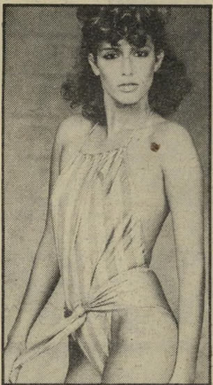
חיתול חושפני לדקיקות ונועזות

שילובי הצבעים מיוחדים ומקוריים כמו צהוב ושחור, סגול וכחול, אדום וורוד עם קשירות בצדדים, רצועות כגב, סיגנון דמויי-חיתול של תינוק, או עיטור בחצאית מיני קצרצה, וכן בשילובי פאייטים, המפארים את בגדי הים והנועדים לעשירות או לכאלה