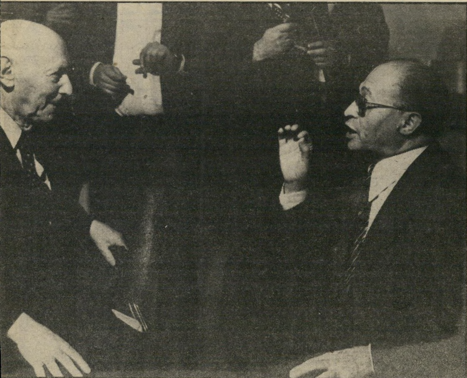
בשביס עם בגין הוא העליב את אבא כשזילזל ביידיש!

במקום לא כליכך טוב ולא כליכך באמצע, ישב גבר אדום-שיער במיטב שנותיו. הוא, בניגוד לאחרים, לא היה לבוש בגוצי או כפוצי. הוא אמנם היה לבוש במיטב מחלצותיו, אך היו אלה מחלצותיו של קיבוצניק, לא של איש-עסקים או תעשיין עשיר, היכול להרשות לעצמו לפזר מאות דולארים בשביל להיות "אין". ישראל זמיר, עורר-מישנה של על המיישמר, מתרגם וסופר, נכח בהקרנה החגיגית בקולנוע שחף לא בזכות חשבון הבנק שלו, אלא בזכות אבות. ישראל זמיר הוא בנו היחיד של הסופר