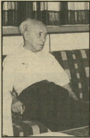
ראשי-עירייה אילון כמו חמין לשבת

התגרשו ♦ ראשי-משלת קנדה היוצא סיריאליוט טורדו (62), ואשתו, מנחת תוכנית טלוויזיה מרגרט (34), אחרי שש שנות פירוד.