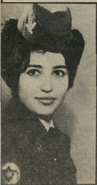
בלה בחיילת תקופה נהדרת