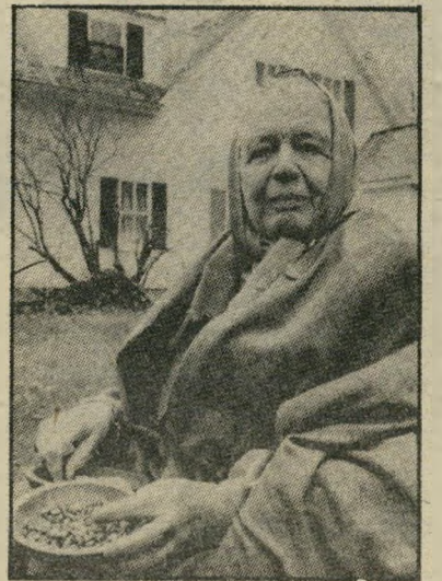
סופרת יורסנר חרב האקדמיה ומיכנסי גינס

העיתונאי פנחס יורמן מביא תחת הכותרת תל-אביב 1934: תמונת מצב, אותה רלה מתוך עיתוני התקופה. הספר יעקוב חורגין, ילד יפו, מביא צרור זיכרונות ואהבה לעיר, שנערותו כוסס כרגליו בחולותיה. אחר מילוי אחוות בית היה יהושע (יו"ש) שלמון.