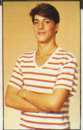
חולצת פסים □