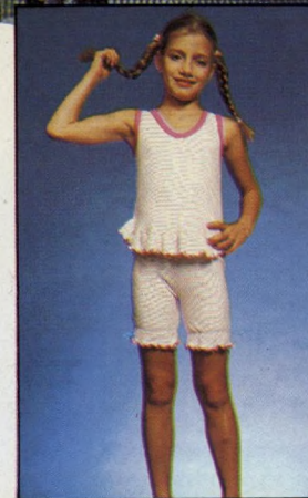
פיג'מה בנות עם וולנים □