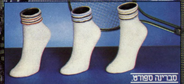
סבריינה ספורט □