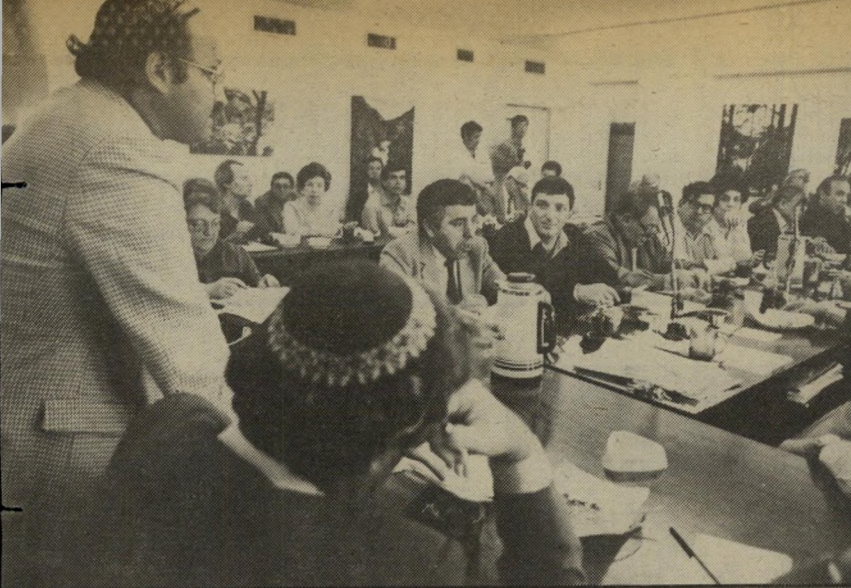
יו"ד ינן פותח את המליאה (לידו: השר המר) מי מציעו

עמדה זו של מנהל-טלוויזיה, שאינו מסוגל לפתור בעצת יחסי-עבודה בטלוויזיה, לא נאתה לנציג המערך כוועד-המנהל, ישראל סגל, ששאל את סער: "תגיד, כך אתה מנהל טלוויזיה? מחכה שאורי פורת יוציא לך את הערמונים מתוך