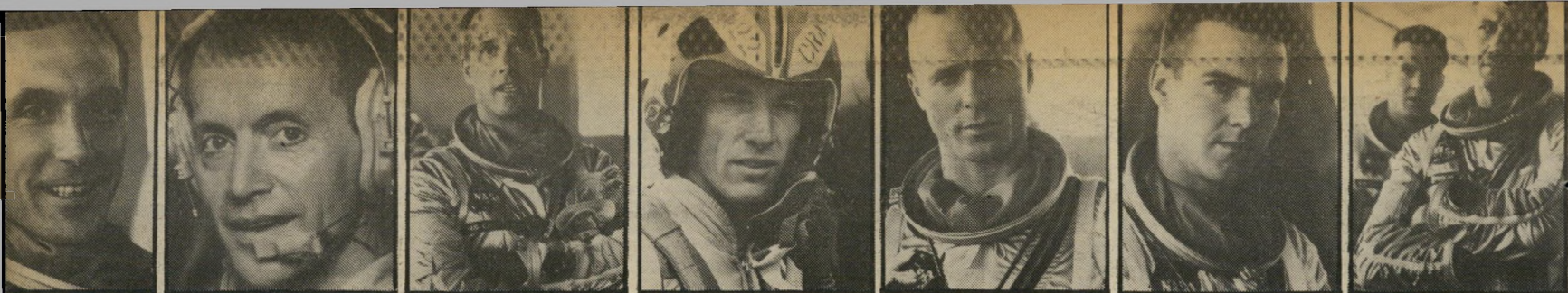
צ'ארל פרנק לנס הנריקסן סקוט פולין סקוט גלן אד האריס דניס קוויד פרד וורד

מאחרי המסיכות. הצוות המובחר מחזיר לתמונה מרכיב אחר, שבדרך-כלל נוסר כסיפורים מסוג זה — נשות הגיבורים. טורדי קופר שנישואיה עומדים לפני משבר והיא מחזיקה מעמד רק למראית-עין (מאוחר יותר הווג קופר אכן התגרשו). אני גלן המתביישת בגימגום שלה (השחקנית מארי ג'ו רשאנל היא רעיית צלם הסרט, כלב רשאנל) או בטי גריסום שאינה יכולה להסתיר את אכזבתה, אחרי שבעלה אינו זוכה לכבוד ויקר כעמיתו, משום שטיסתו לא הושלמה כאותה המידה של הצלחה. בין כולן רק אחת ניראית כבת הלוויה הקלאסית של גיבור קלונוע אמריקאי, וכצפוי, זו רעייתו של ייגר, גלניס (ברברה הרשי).