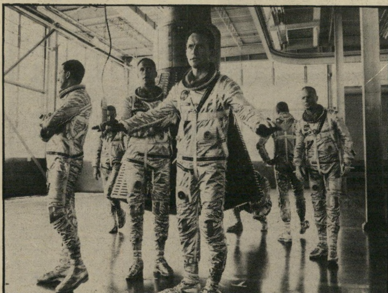
טייסי מרקורי רואים לראשונה את תא החללית בסרט „הצוות המובחר“ המכונה המשוכללת ביותר

דמויות איראיליות של אנשי החלל, מתקבל באור שאינו מחמיא ביותר. המדענים מדברים כולם במיבטא גרמני כבד, ובשלב מסוים, כאשר מדובר על המירוץ בין ברית-המועצות וארצות-הברית כחלל, מזכירים את „הגרמנים שלהם והגרמנים שלנו“. כמעט כמו האמריקאים כדורסל הישראלי.