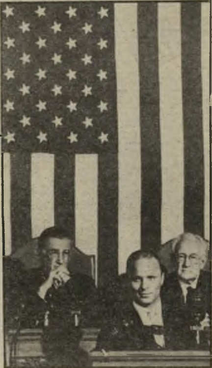
אד האריס בתפקיד ג'ון גלן נאום קולנועי

הרעיון הבסיסי היה שחבר בתוך ברית האחוזה הגברית הוא יהיה מסוגל לטפס אל על, בתוך מכונה שחלק מתכונותיה הן עדיין חידה, לסכן את עורו ולהיות מצוייד במידה הנכונה של חוצפה, תגובות מרויכות, קוריוז וניסיון. כדי להביא את המכונה עד קצה גבול הסיבולת שלה ואז לעצור, כדי לחזור על כך ביום שלמחרת, ויום אחרי זה, וכן הלאה.