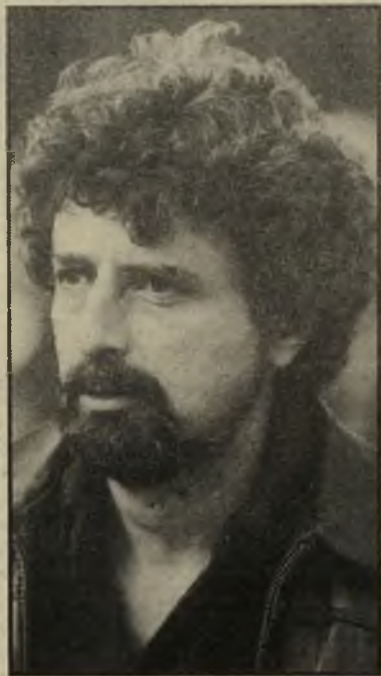
בימאי פיליפ קאופמן מאצ'ו או שוביניסט גברי

אצל וולף אמנם מדובר במטוסים ובטיסה לחלל, אבל האתגר זהה — לפרוץ, בעזרת נתונים קיימים, אל תוך אזורים שלא חדרו אליהם עדיין.