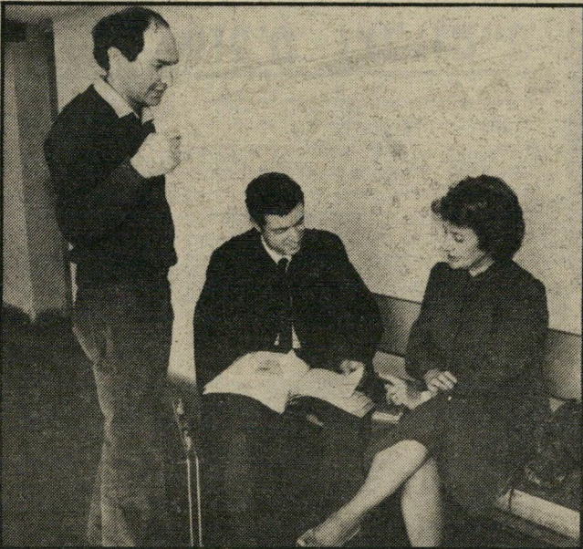
יחזקאל ונציגי ועד המשתכנים לא להסתכן

שנים עברו, החוסכים השקיעו את כספם והמדינה לא בנתה. בשנת 1979 החלה בוררות בין המדינה וחלק מן המשתכנים, כדי לסכם את הפרשה. מכס קנת שהיה הבורר, פסק את אשר פסק, נערכה הגרלה בין המשתתפים בבוררות והדירות חולקו למשתכנים.