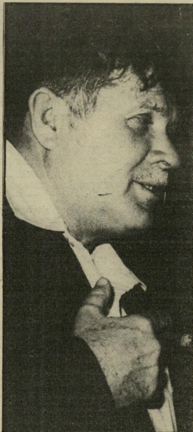
שרחקלאות גרופש אי-אפשר להמשיך

"נאלצתי לעקור. פואב הלב, אבל אין ברייה. אם זה מה שהמדינה רוצה."