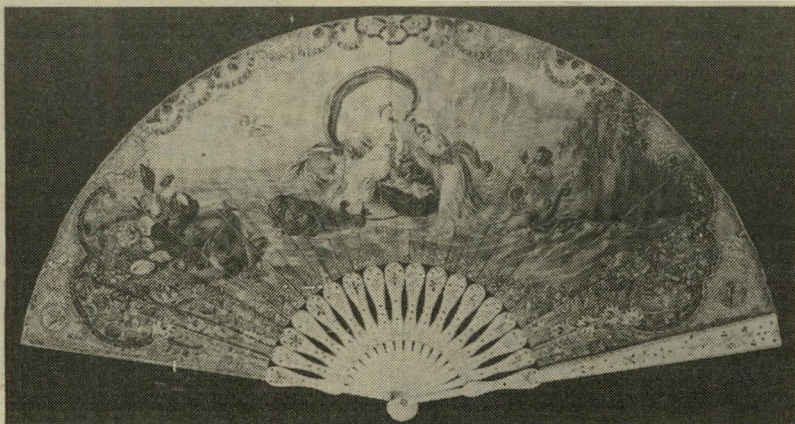
מניפה מהמאה ה-19 אולי 4000 דולר