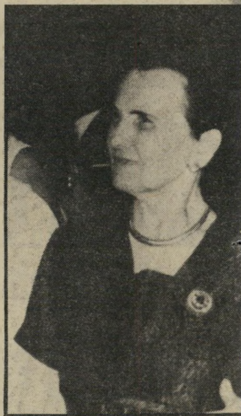
הגברת עד גיל 84 המי שיכה האם הישי שנה לה את מלון אורגיל בחיפה.

הוא גוייס ונשלח, ללא אימונים מוקדמים, לקרב ביר-מרדכי, שם נפצע פעמיים. אחרי חודש נהרג צביקה, כשנפלה יד-מרדכי בידי המצרים. ל חייה לא פסקה יפה לעבוד. היא מונתה על-ידי הבן כמנהלת מלון אורגיל בחיפה, ועבדה שם בשכר. היא הכירה כל חברי-כנסת וידעה מה כל אחד מהם נוהג לאכול. אצלה לא היה כיבוד, היא היתה מסתובבת בחדרים ודואגת לכבות אורות מיותרים. מה שהיה מביא אותה לידי כעס היה מה שכינתה "הישראלי המכוער", שהיה מעמיס על צלחתו ולוקח מזון מיותר מהמיוזנונים. היא לא התביישה להעיר, ואפילו להוריד מנות מיותרות. גם כשפרשה, לפני 10 שנים, ועברה להתגורר במלון דיפלומט בירושלים, המשיכה לכבות את האורות, והיתה מסתובבת במלון כבעלת המקום. ליפה שיף היה מפתח לחדר עבודתו של בנה. לא אחת היא היתה נכנסת לחדר ומסלקת את היושבים בו, כטענה: "שחיימקה עבר מספיק, הוא עייף, ואתם מבלבלים לו את המוח.