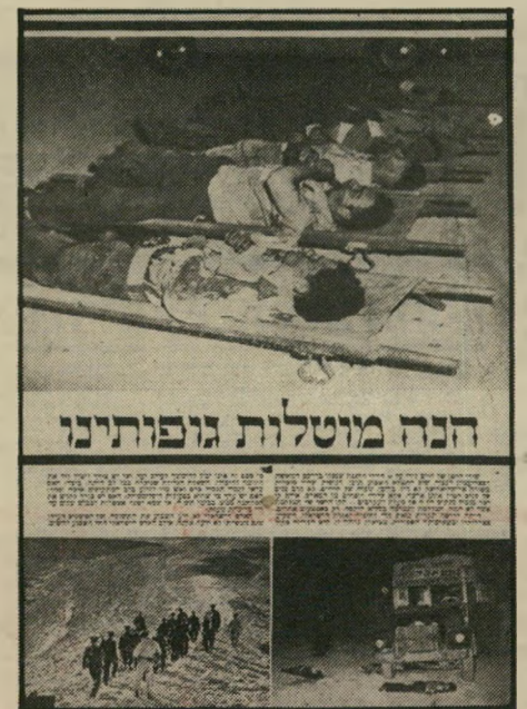
הנהג מוטלות גופותינו מתיחת הכתבה ב"העולם הזה" (25.3.54) קיביה - מעלה-עקרבים - נחלין...

כי העובדה הראשונה שהזדקרה במקום הרצח היא: הוא קרה אחר-כך. ל מ ר ו ת קיביה, עד אותו רגע שררה ההרגשה כי קיביה, עם כל נוקיה הפוליטיים והמוסריים, הביאה בכל זאת ברכה אחת. התוקפנות על הגבול כמעט פסקה. גל ההסתננות ירד. "מעלה-העקרבים מוכיח כי היה זה חשבון מוקדם מדי... מישיחקה-הרמים של רצח-תגמול-רצח מסתובב במעגל-קסמים שאינו מוכיל לשום מקום. אין בו פיתרון של ממש." העולם הזה הציע לפתוח במיבצע-שלום גדול, שיביא לשינוי-ערכים בעולם הערבי כולו. הפיתרון המרחבי, בניגוד לדרך התגמול ומלחמת-העמים. במציאות קרה ההיפך. למרות אזהרתנו, פשט צה"ל על כפר ערבי אחר — נחלין.