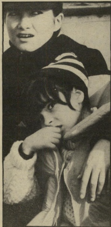
קלבין וילדתה ג'וליה בשמות בדויים

כך מסביר דינסט את גישתו לתסריט שכתב, תסריט המבוסס על עובדות שפורסמו באמצעי התיקשורת בלבד. כאשר שלח את התסריט לגיבורת המעשה, הוא נענה בשתיקה מוחלטת. אולי משום שבאותו השלב היא כבר הבטיחה את שיתוף הפעולה שלה לגירסה השנייה של הסיפור.