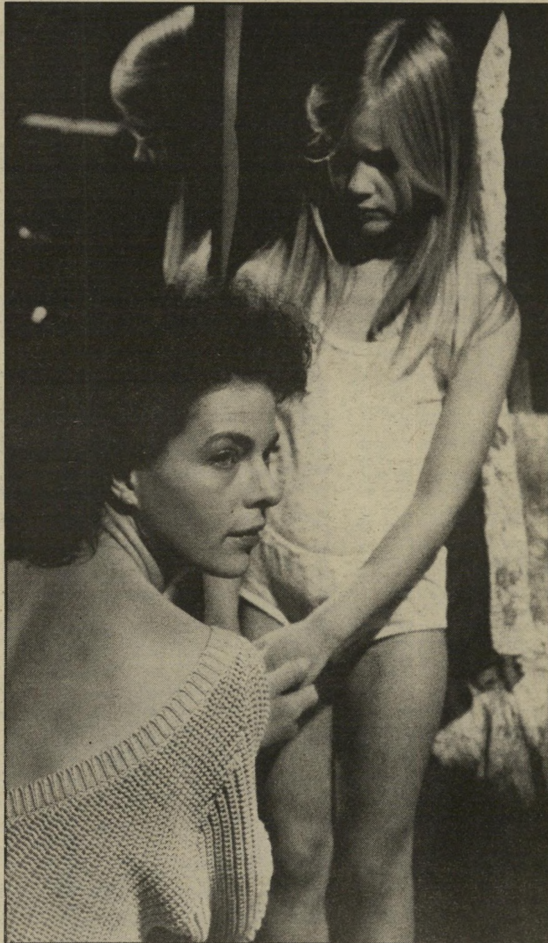
גוררון לאנדגרבה בתסקיד האם בסרטו של בורק הארדט דינסט הבימאי ישב בעצמו בכלא

דינסט הוא לא רק נראה כמו גאנגסטר מן הסרטים, הוא אף היה כזה וישב בכלא על שוד מזויין של בנק. מאז יצא החוצה הופיע בסרט שבו תואר למעשה סיפור חייו, כשהוא משתתף בכתיבת התסריט, ועתה הוא נטל את פרשת באכמייר כחומר לסרט הראשון שהוא מביים. אין לי שום רצון להיכנס לתוך המניעים של האם, להבהיר את התנהגותה, אני מכיר היטב את עולם העבריינות ואני יודע שאפשר תמיד לספק הסברים והבהרות לרוב, אבל אין זה מסביר ואין זה מבהיר אף פעם.