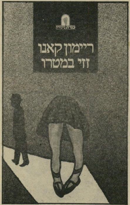
עטיפת 'זוי במטרו' מזמסריאחאכוכך

היערנות שקשקשת קדם? תענה: היא מתחילה לצבוט את רודה, במטרה שיענה לה. והלאה מגיע סיפורו של מועדון ההומוסקסואלים, שבו מתפרנס הרוד גבריאל מריקודי סטריפטיז: זוי במטרו מסתים, כאשר נגמרת שכינת המטרו, זוי עולה עליו, ונשאלת אם נהנתה בפאריס וראתה את המטרו זוי משיכה, לא? ומוסיפה, 'התבגרת'.