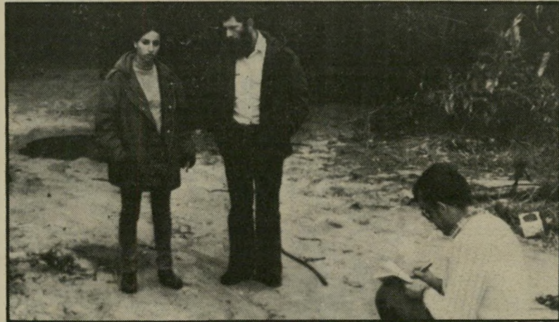
רס"ר רווח (במרכז) במקום הרצח למרות הדימוין המפתיע...

הוא אומנם יוצא־דופן בין אנשי המישרה בלבושו, אך הוא שוטר רתי מוצלח מאוד, ועומר