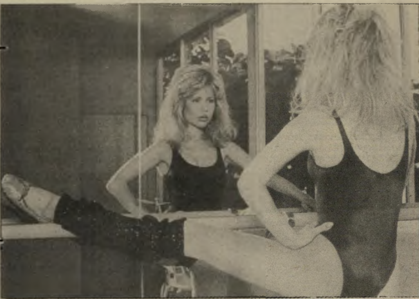
סיה זאדורה בושות