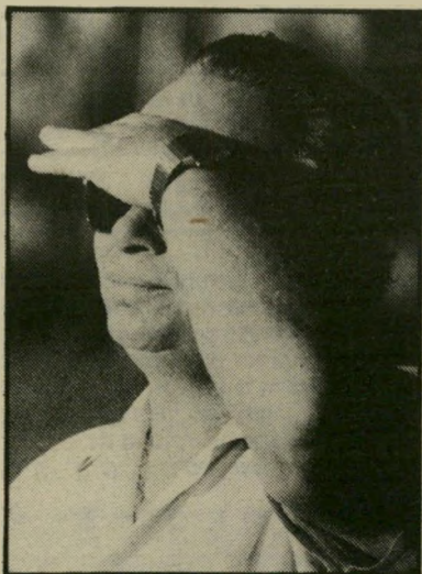
מאמן שווייצר תיסמונת

הוא השתחצן על ימין ועל שמאל, סגר חשבונות עם כל מי שרק ציין לעומתו. אלא שבשמונה המחזורים האחרונים קרה דבר מוזר. במשך כל הזמן הוזה שכחו שחקניו של שווייצר את טעמה של תרועת הניצחון על המיגרש. משום מה הפסיקו שחקני בית"ר את ביצועיהם המבריקים