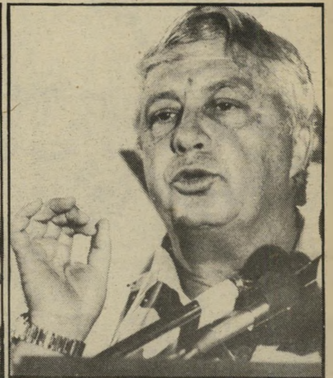
אריק שרון להאיץ פעילות ישראלית

לתיקשורת ולאלקטרוניקה, המשמש באורח ישיר לפעולות דיכוי פנימי, ללא כל קשר לביטחון המדינה, הוקם על-ידי חברת תדיראן. החברה השקיעה בגואטמלה כ-12 מיליון דולר, בשלב