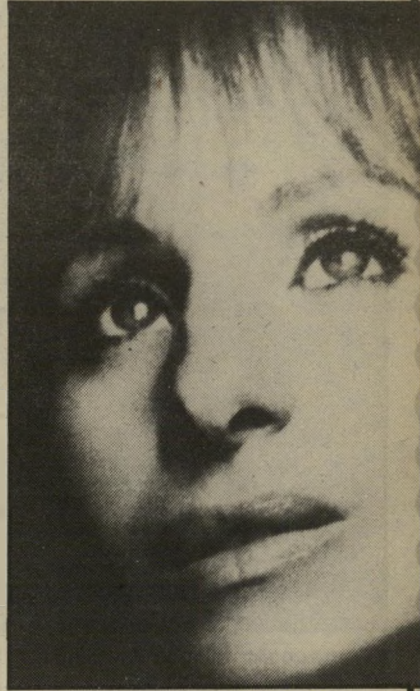
ברברה סטרייסנר כוכב נולד