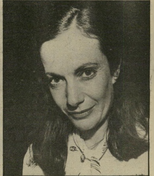
פטרה קוגליק היא הגיעה הישר נערות ישראליות אינן מסכימות להתפשט בסרט. טים. משדה-התעופה הגיעה ישר למסיבה בחמזא.