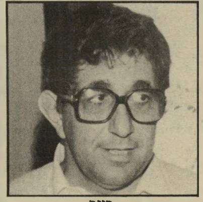
ריגר יש יורשים

הו צו האופנה, כמו שאומר לי אחד מעמודי התווך של הבורסה, וכשאני מעיר לו שאת אימרת-השפר החכמה הזו, אמר לפני כמה יובלות יהודי חכם בשם מאיר רוטשילד: לקנות בירידה, למכור בעליה והוא באמת עשה הרבה מיליונים, ואילו אתה, שמתהדר בנוצות לא לך, בסך הכל גומר את החודש ולפעמים בחריקה. אני כמובן לא יודע מתי תערכנה הבחירות לכנסת. עד עכשיו חיינו בתוך אי-ודאות כלכלית וככלל. עכשיו יש כיוון באירואות: עד לבחירות לא תהיינה גזירות וגם אלה שישנן יצאו לחופשת בחירות, או אולי יעברו להציג מישרה. זה אומר